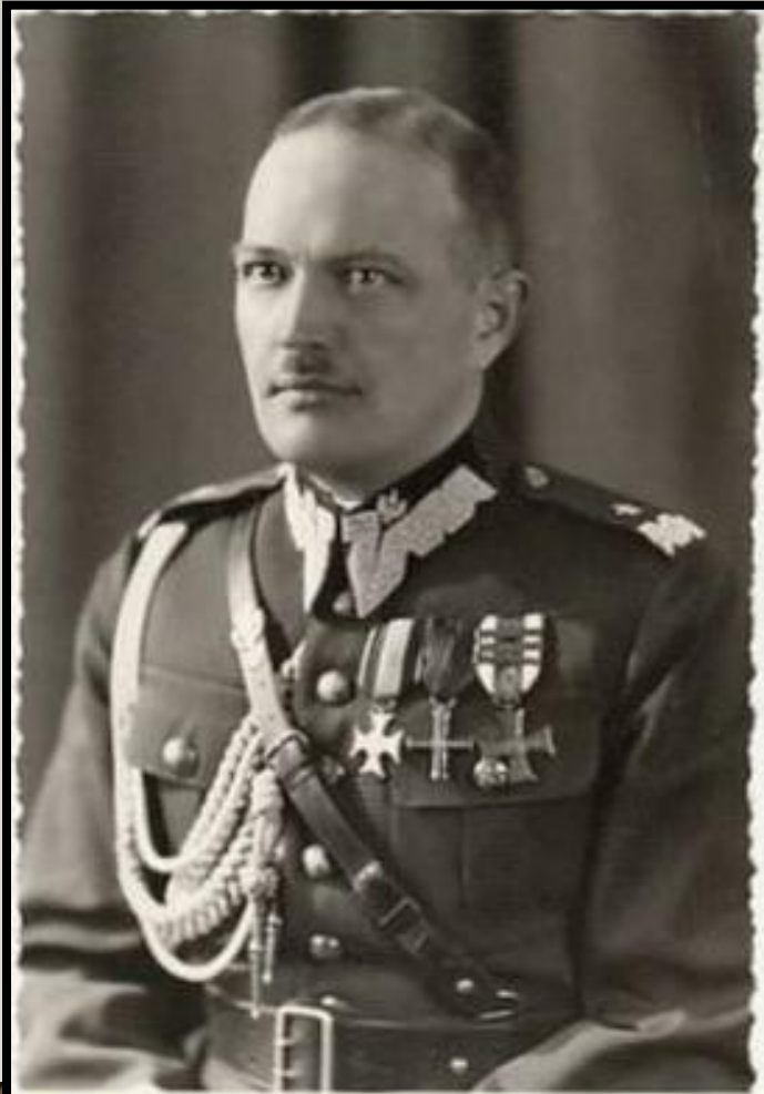
Gen. dyw. Mieczysław Smorawiński

Obok naszej szkoły jest ulica gen. bryg. Mieczysława Smorawińskiego.